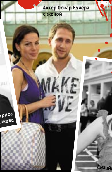
Актер Оскар Кучера с женой